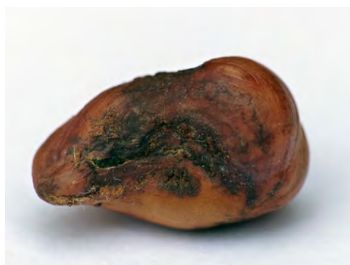
Abb. 2: geschädigter Nusskern