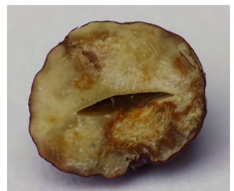
Abb. 3: geschädigter Nusskern im Querschnitt