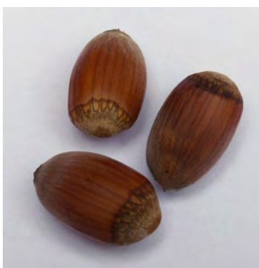
Abb. 1: befallene Nuss mit intakter Schale

1). Nach dem Knacken der Schale waren auf den Kernen eingesunkene Nekrosen zu erkennen (Abb. 2). Im Querschnitt war der Kern partiell verbräunt und wies kleine, weißliche, faserig-schwammige Bereiche auf (Abb. 3). Eine vollständige Trockenfäule stellt das Endstadium dar. Dieses Symptombild wird als Stigmatomycose